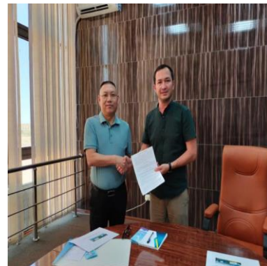
Рисунок 2. Встреча с потенциальным инвестором-компанией «Chongqing Glion New Material Technology Co.,Ltd.»