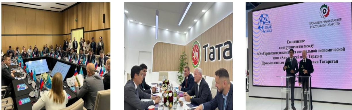
Рисунок 4. Участие в международной промышленной выставке Иннопром 2023

Также между СЭЗ «Химический парк Тараз» и Промышленным кластером Республики Татарстан подписано «Соглашение о сотрудничестве», установив намерение оказывать друг-другу всестороннюю поддержку. (Рисунок 4)