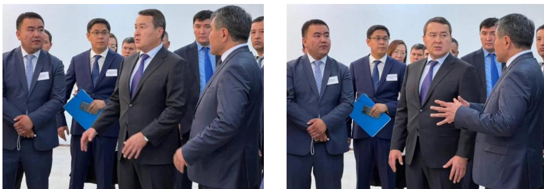
Рисунок 3. Рабочая поездка Премьер-Министра РК Алихана Смаилова на территорию СЭЗ «ХимПарк Тараз»

В ходе рабочей поездки в Жамбылскую область Премьер-Министр РК Алихан Смаилов ознакомился с новыми инвестпроектами на базе СЭЗ «Химический парк Тараз». (Рисунок 3)